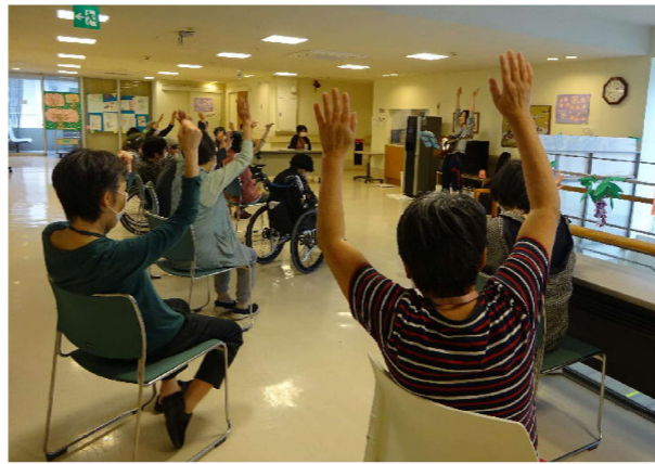
音楽リハビリでは音楽に合わせて動きます

すみれフロアでは、日中の活動として、音楽リハビリやペーパークラフト、塗り絵などを行っています。外に出たり、他のフロアとの交流が出来ない中、少しでも楽しく過ごせるように工夫しています。運動不足解消のため、朝昼の体操も続けています。天気の良い日には、人込みを避け、近隣の散歩に出かけています。周囲には緑が多く、絶好の散歩スポットです。