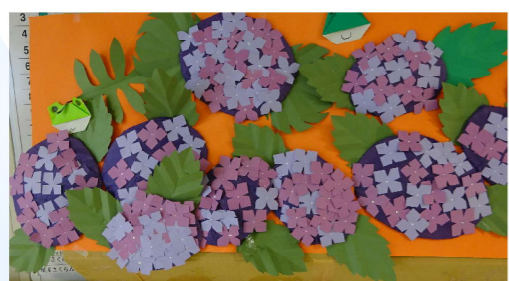
あじさいのペーパークラフト