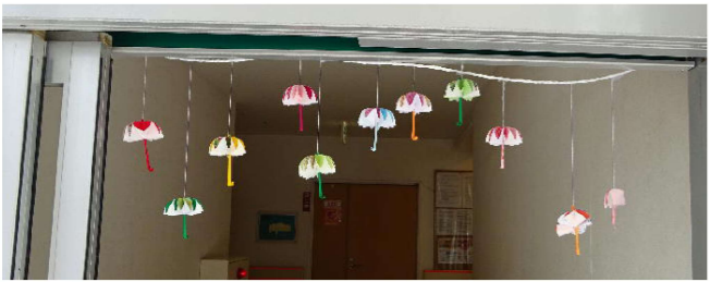
傘のペーパークラフト

屋内は、アートの達人がさまざまな装飾を制作してくれれます。グループで作品を作ることもあり。季節感のあるペーパークラフトが素敵で、雨の季節も楽しくなります。