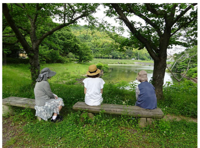
散歩の途中、ベンチでひと休み