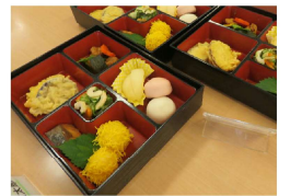
豪華、お祝いのお膳

敬老の日の3日前の9月16日に、丸山荘では敬老のお祝いをしました。お昼には特別メニューが用意されました。保育園の園児さんからは、可愛いメッセージ入りのプレゼントをいただきました。ありがとうございました。