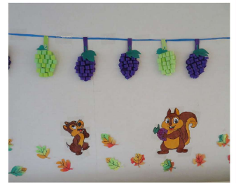
ブドウ狩りの季節です