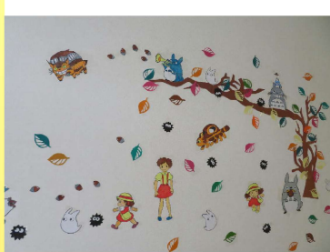
フリーハンドで書いて切ってくれました