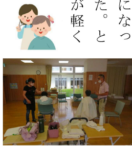
広々スペースで散髪中