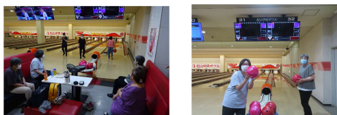
(ナイスゲームでした)

6月、2回に分けて松山中央ボウルへボウリングに行きました。ストライクやスペアが出ると、入所者同士でハイタッチする様子も見られ、大盛り上がりでした。皆さん良い気分転換になったようで後日、七夕の短冊に「ボウリングにまた行きたい」と願いを書いている参加者もいました。