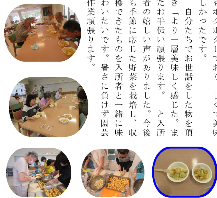
(ジャガイモの下処理も入所者が手伝ってくれています)

自分たちでお世話をした物を頂き「より一層美味しく感じた。またお手伝い頑張ります。」と入所者の嬉しい声がありました。今後季節に応じた野菜を栽培し、収穫できたものを入所者と一緒に味わいたいです。暑さに負けず園芸作業頑張ります。