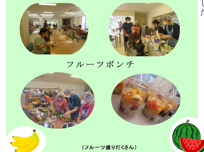
(フルーツ盛りだくさん)