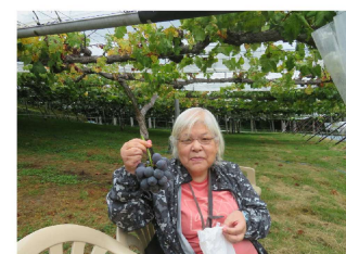
ピオーネいただきました！