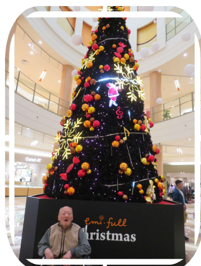
ちょっと寄り道・・・