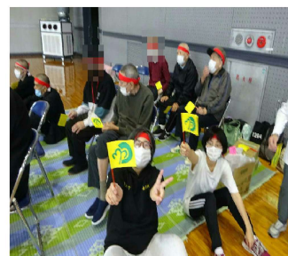
応援もがんばりました