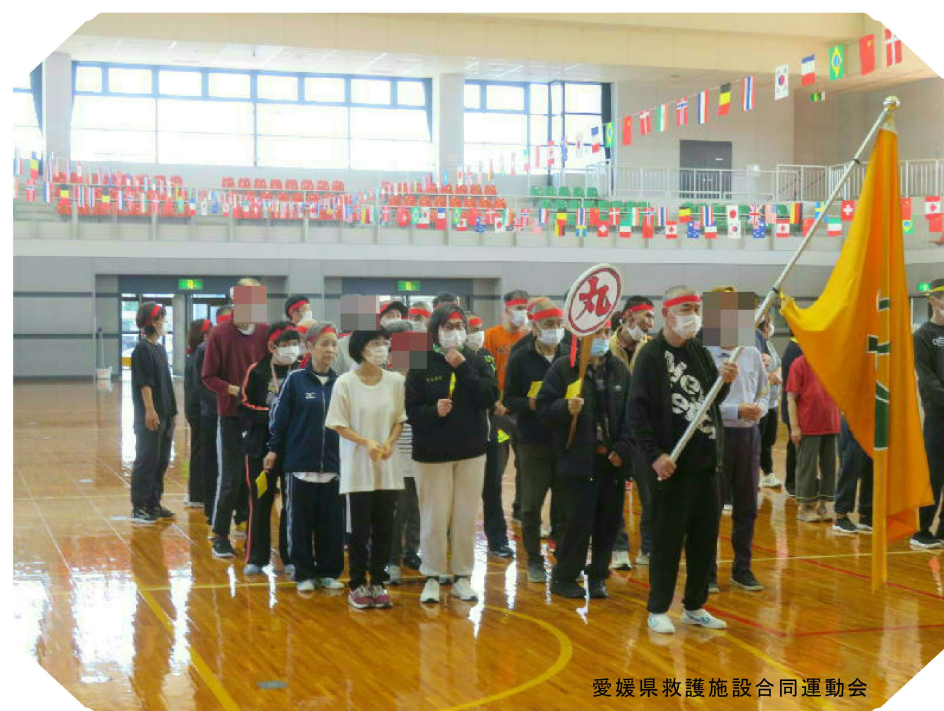
愛媛県救護施設合同運動会