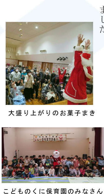
大盛り上がりのお菓子まき