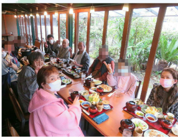
皆でハイ・チーズ！

さつき・さくらフロアでは希望者を募って、好きなお店を選んで頂き外食に行きました。また行きたいという声が多かった。聞かれました。