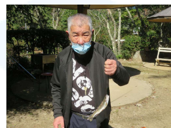
自分で釣りました

観楓も兼ねて竹山荘へ遠足に行きました。釣り堀で鱒を釣り、調理してもらい食べました。自然の中で食べる山菜料理はどれも美味しく、参加された入所者の方も夢中で食べていました。